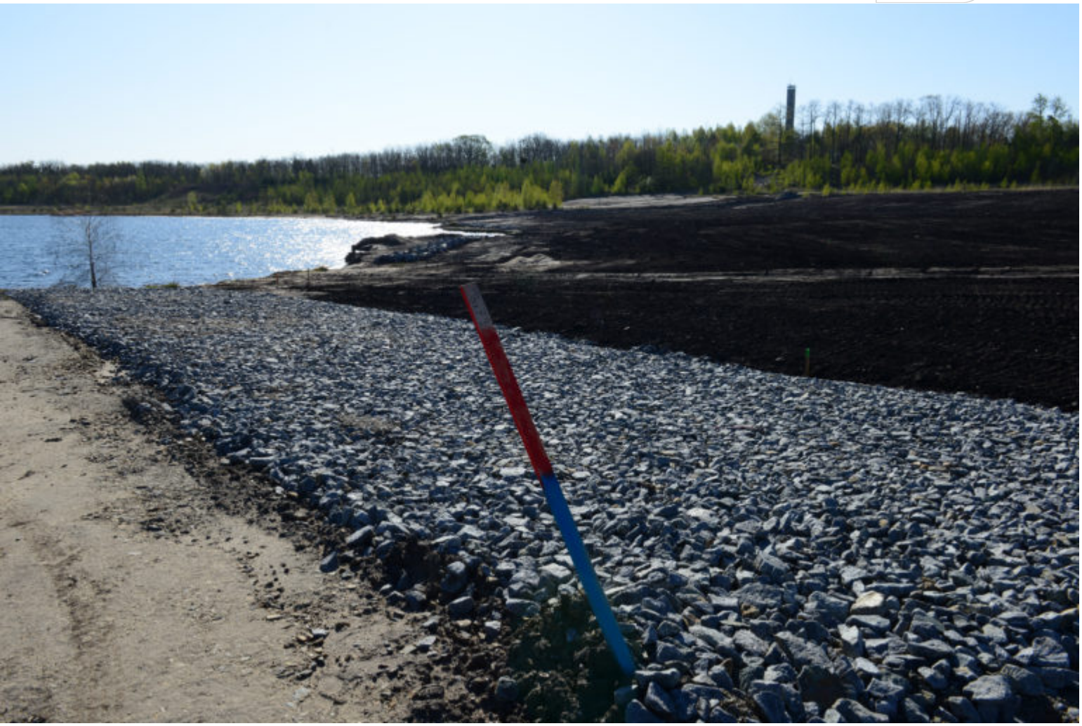
Verfüllung der Erosionsrinnen am Großräschener See auf Sedlitzer Seite