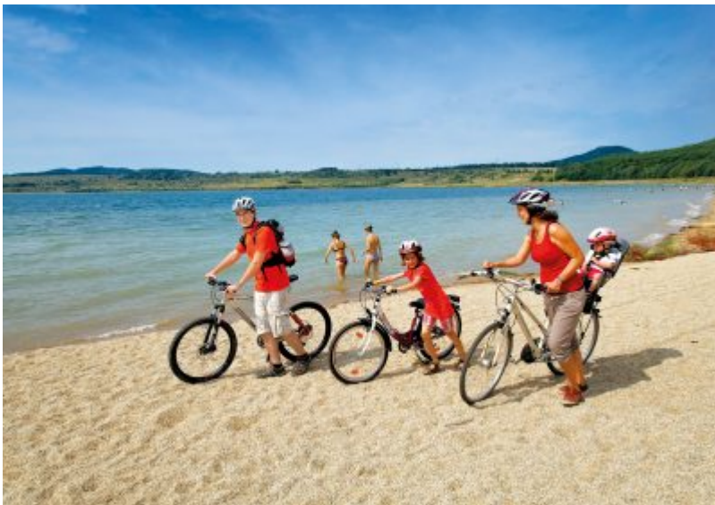
Fahrradfahrer am Berzdorfer See

Zertifikat seit 2023 audit berufundfamilie