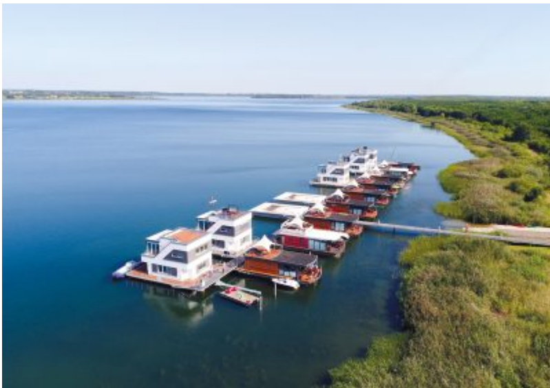
Schwimmende Häuser am Goitzschesee

Zertifikat seit 2023 audit berufundfamilie