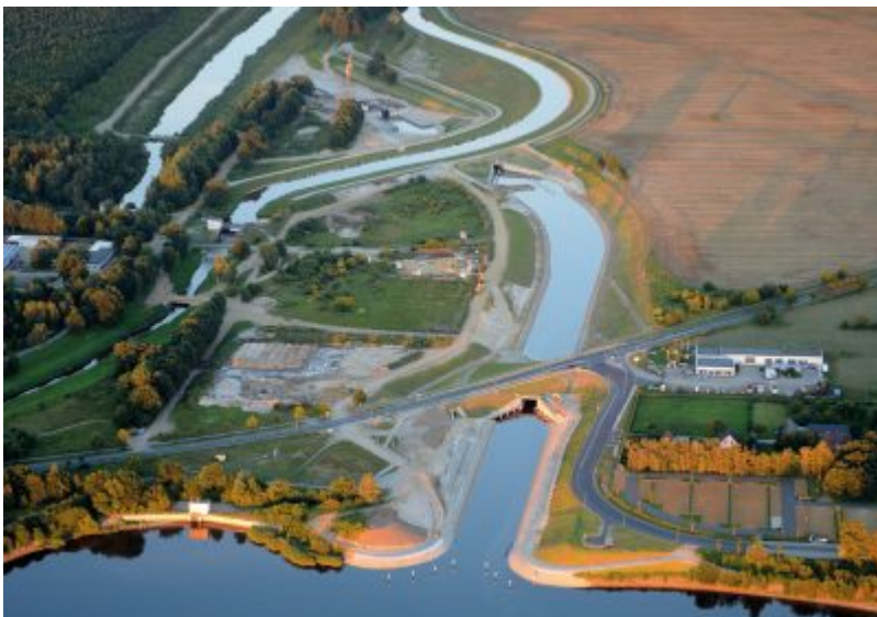
Koschener Kanal im Lausitzer Seenland