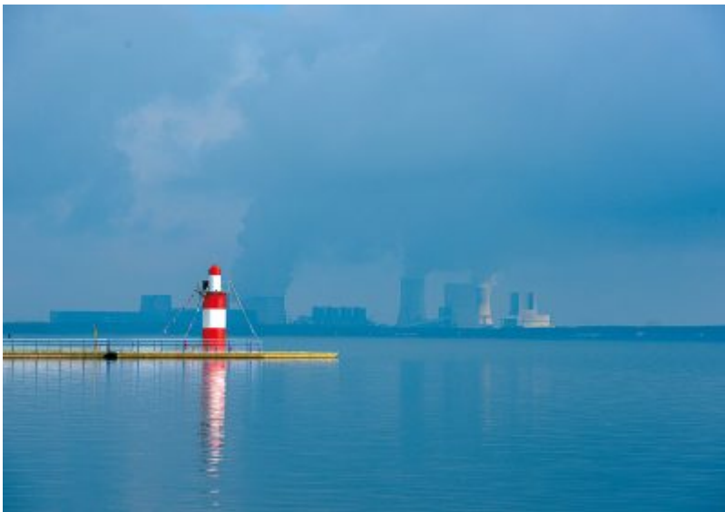
Leuchtturm am Bärwalder See

Zertifikat seit 2023 audit berufundfamilie