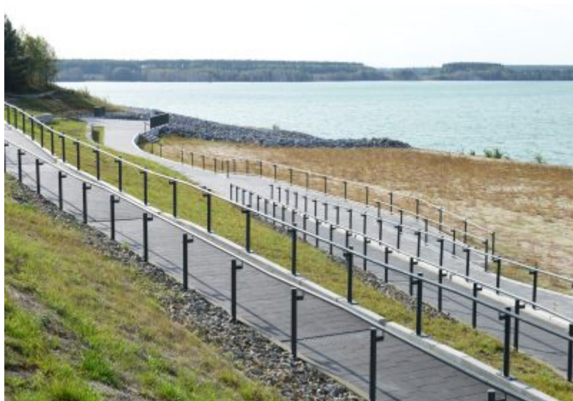
Seestrand Lieske am Sedlitzer See