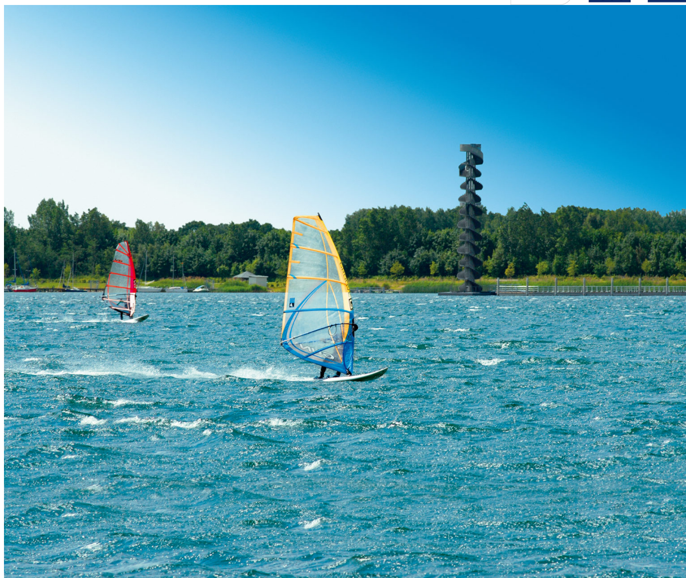
Surfer auf dem Großen Goitzschensee