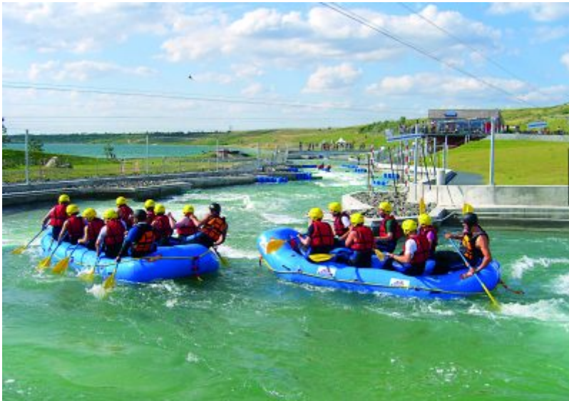
Kanupark am Markkleeberger See