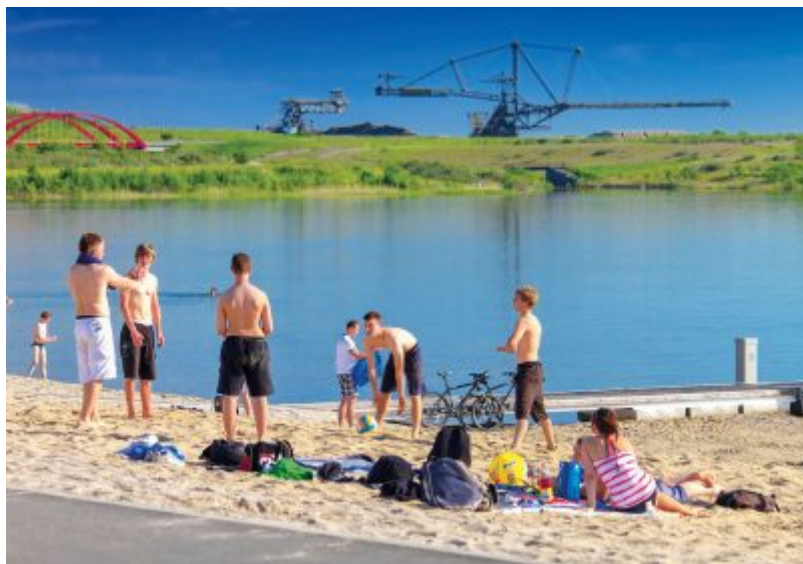
Strand am Markkleeberger See