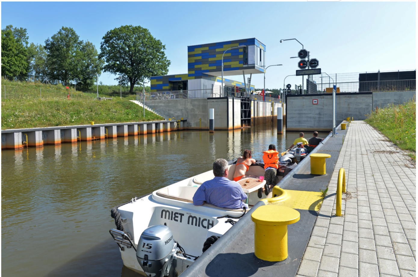
Bootstourismus an der Schleuse am Koschener Kanal

Die LMBV unterstützt den Strukturwandel in beiden Revieren. Sie fördert die touristische Entwicklung, indem sie die ehemaligen Tagebauareale funktionsgerecht, ökologisch nachhaltig und sozial verträglich saniert und gestaltet. Sie bereitet den Weg für ein harmonisches Miteinander von Naturschutz und Tourismus.