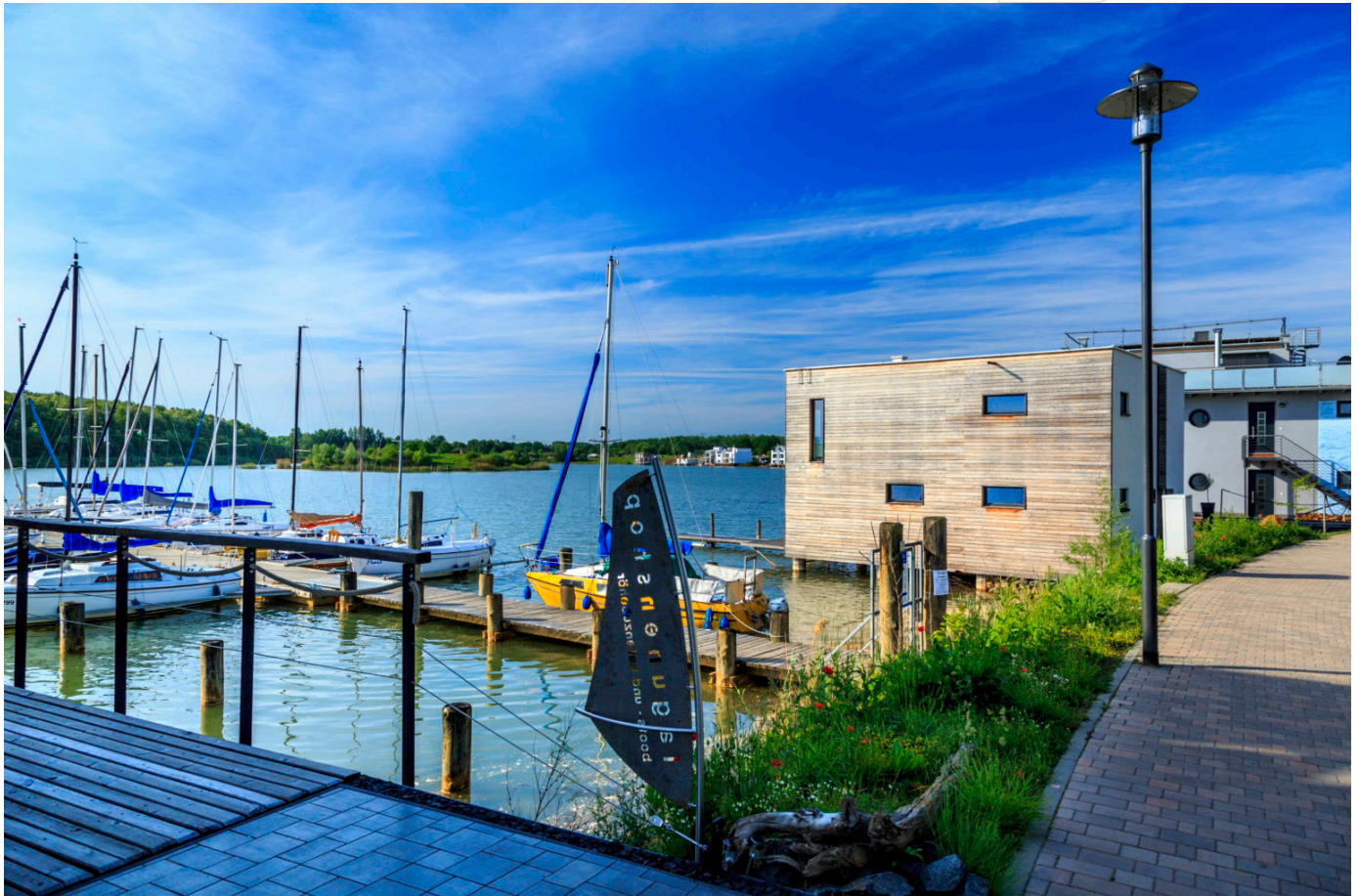
Lagune Kahnsdorf im Leipziger Seenland