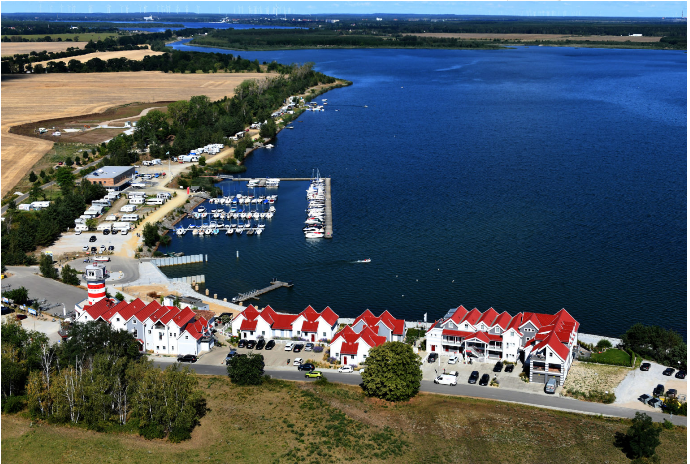
Marina und Wasserwanderrastplatz am Geierswalder See