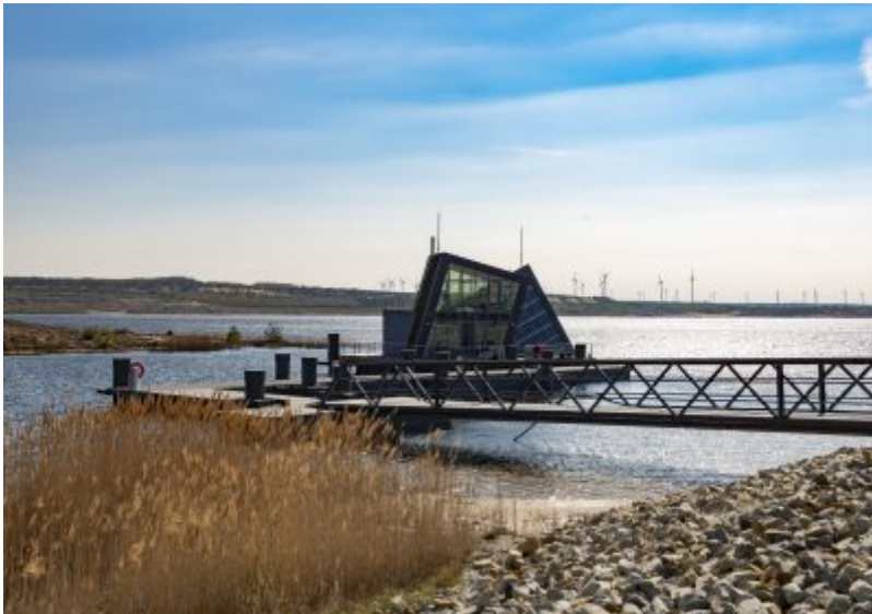
Steganlage am Bergheider See