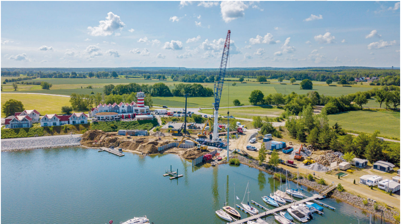
Dalbensetzen am Wasserwanderrastplatz Geierswalde