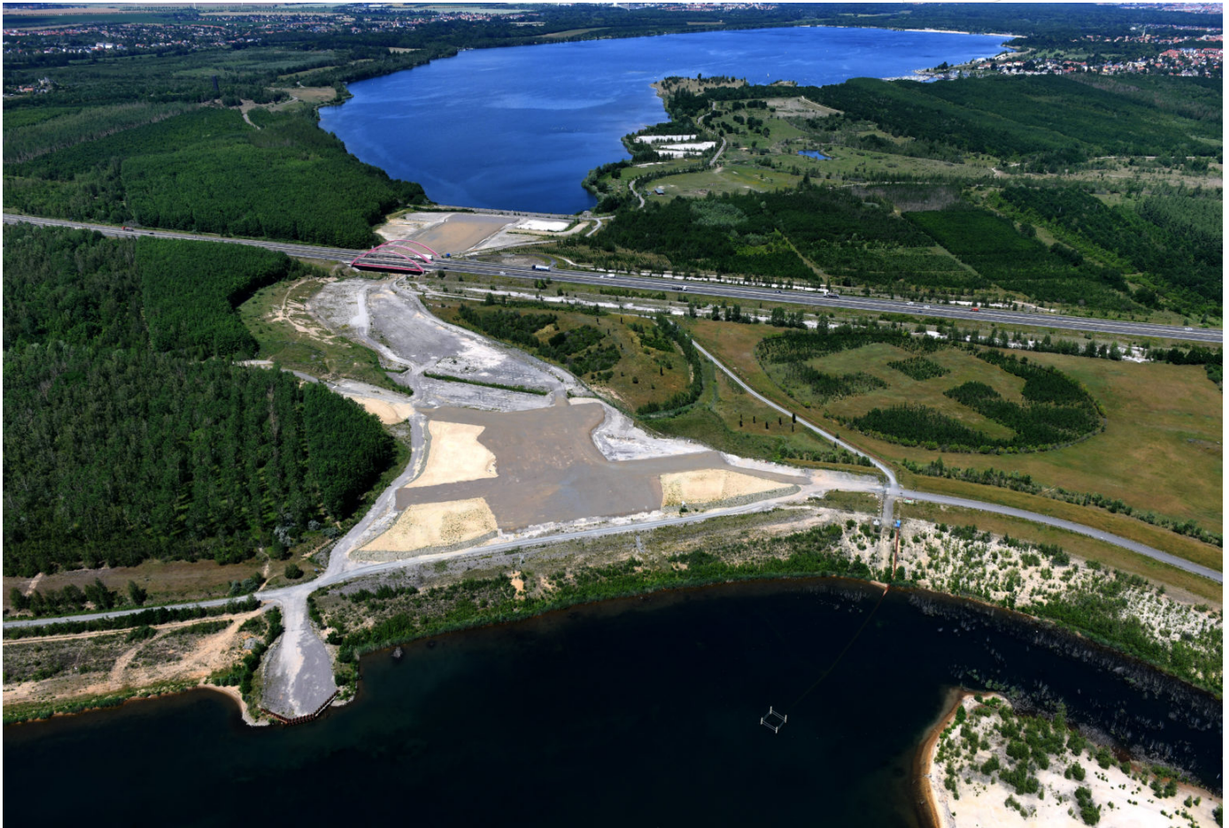
Entstehender Harthkanal zwischen Zwenkauer und Cospudener See