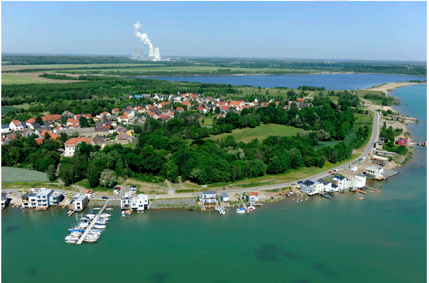
Lagune Kahnsdorf am Hainer See