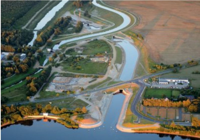
Koschener Kanal im Lausitzer Seenland