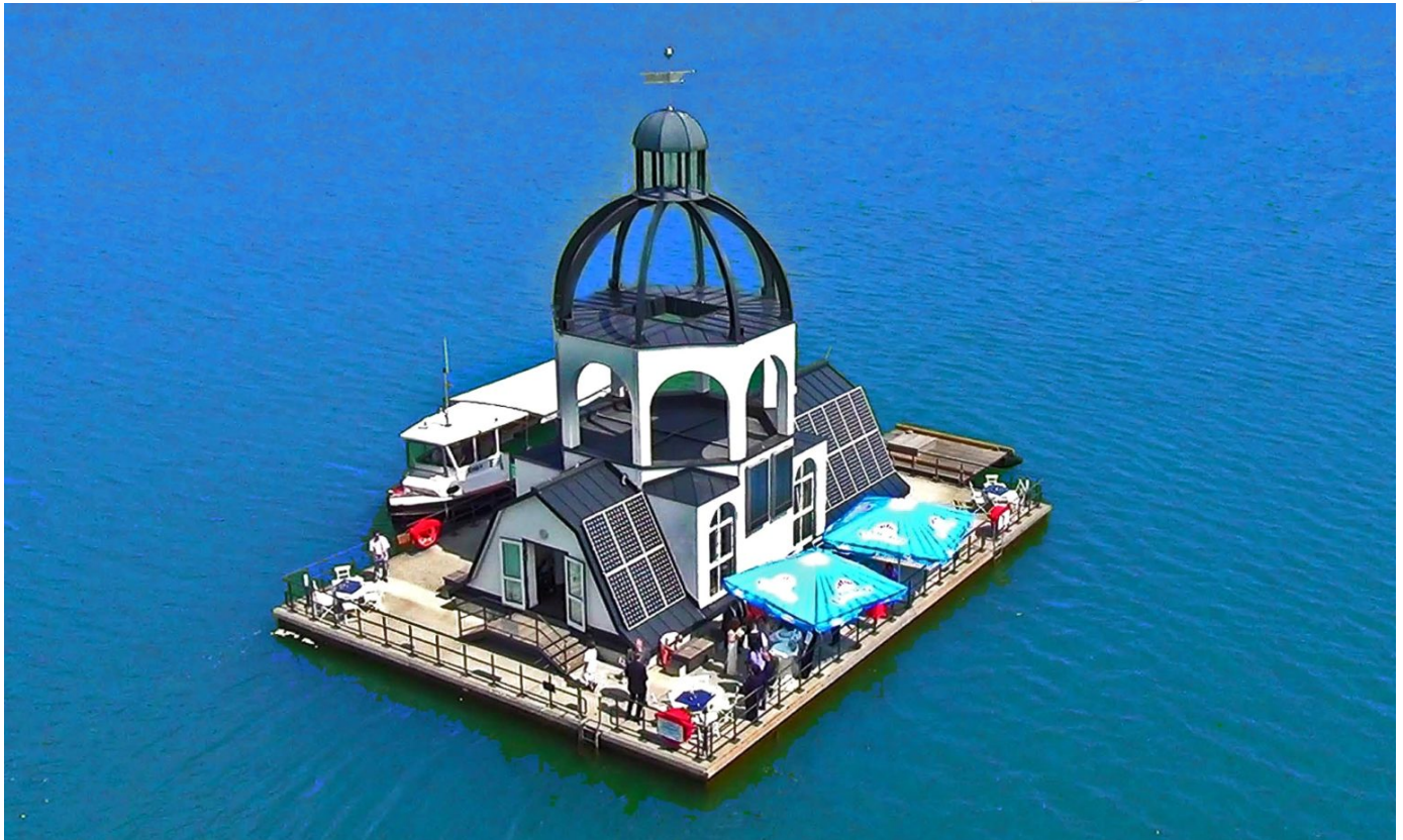
Schwimmende Kirche VINETA im Störnthaler See