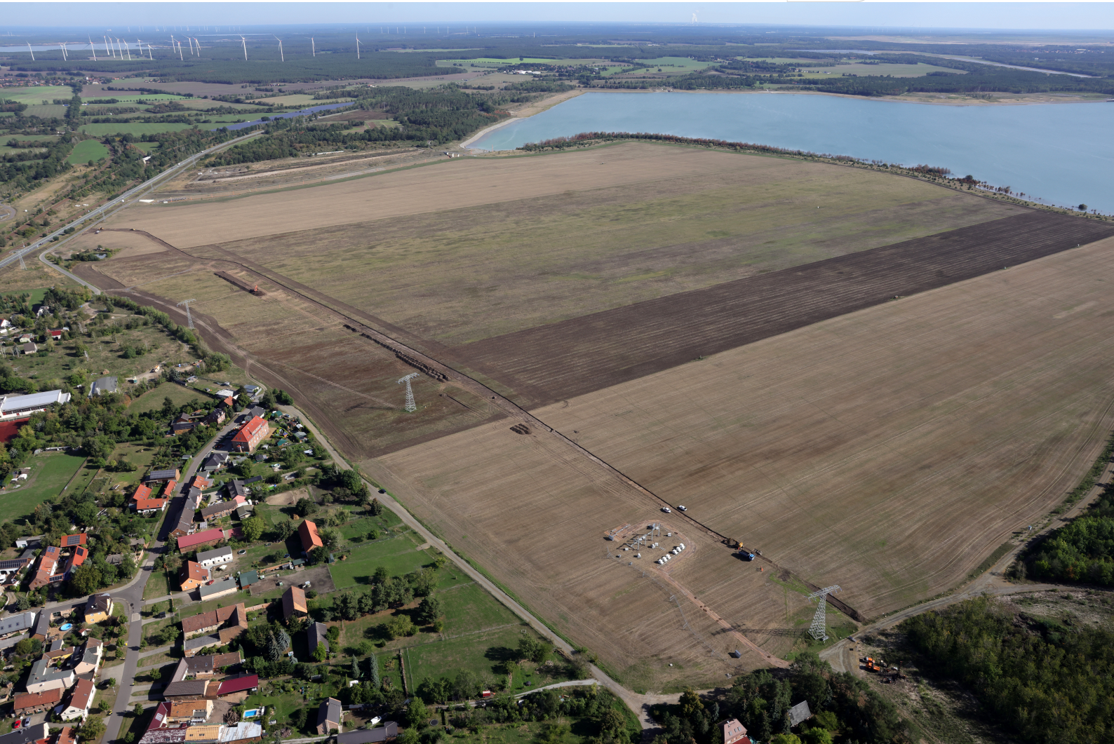
Errichtung der Nordzufahrt zu Brückenfeldkippe Sedlitz