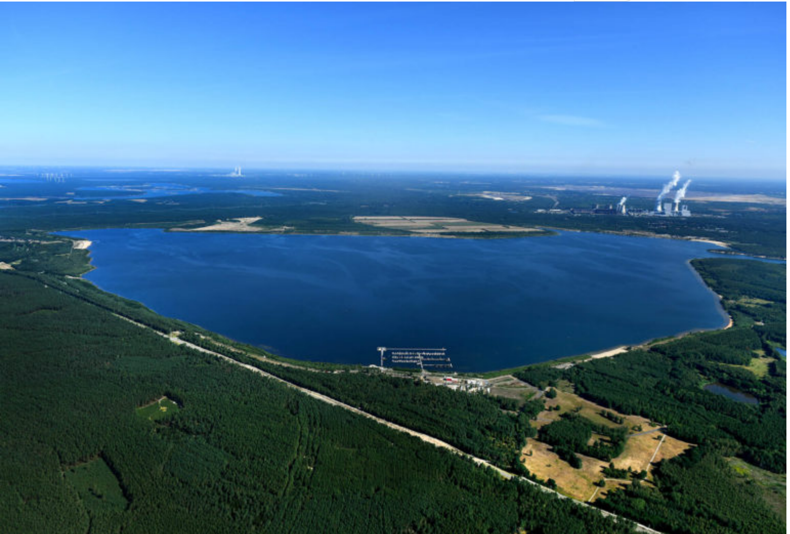
Bärwalder See aus der Luft

Mehr als 75 Millionen Kubikmeter Wasser in 2021 für Flutung in der Lausitz bisher genutzt