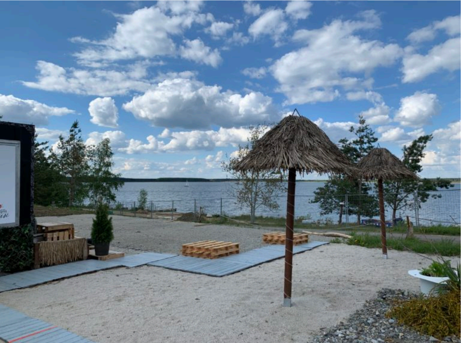
Vor dem Saisonstart: Bald neues Strandfeeling am Geierswalder See