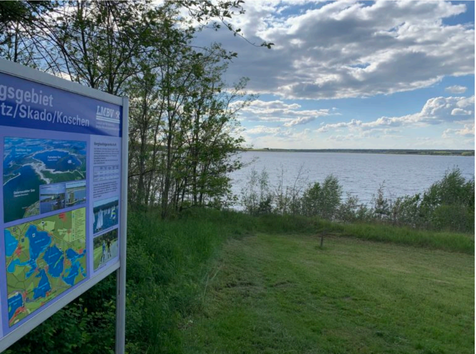
Geierswalder See hat wieder seinen Zielwasserstand erreicht