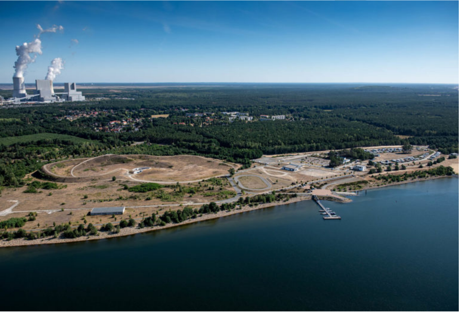
Boxberger Steganlage am Bärwalder See