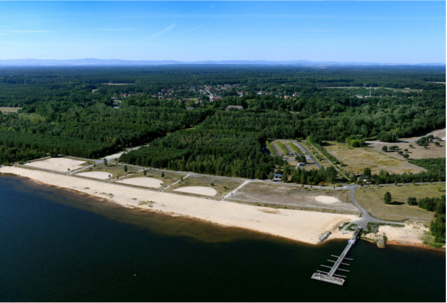
Bärwalder Seeufer mit Steg bei Uyhst