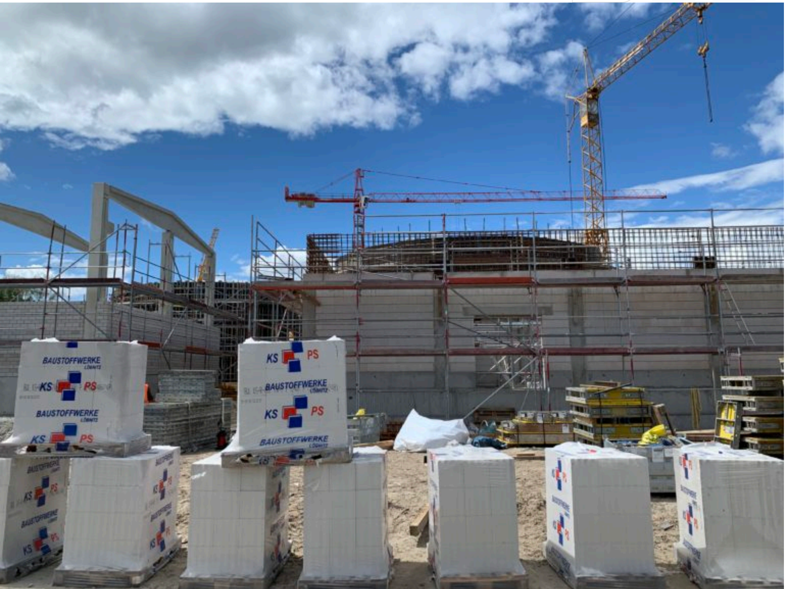
Blick auf die Baustelle