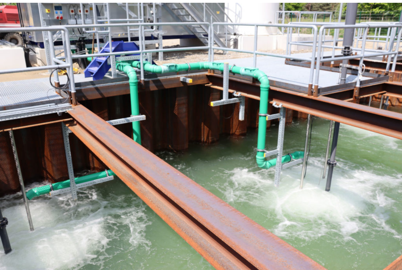
Inbetriebnahme des Reaktionsbeckens