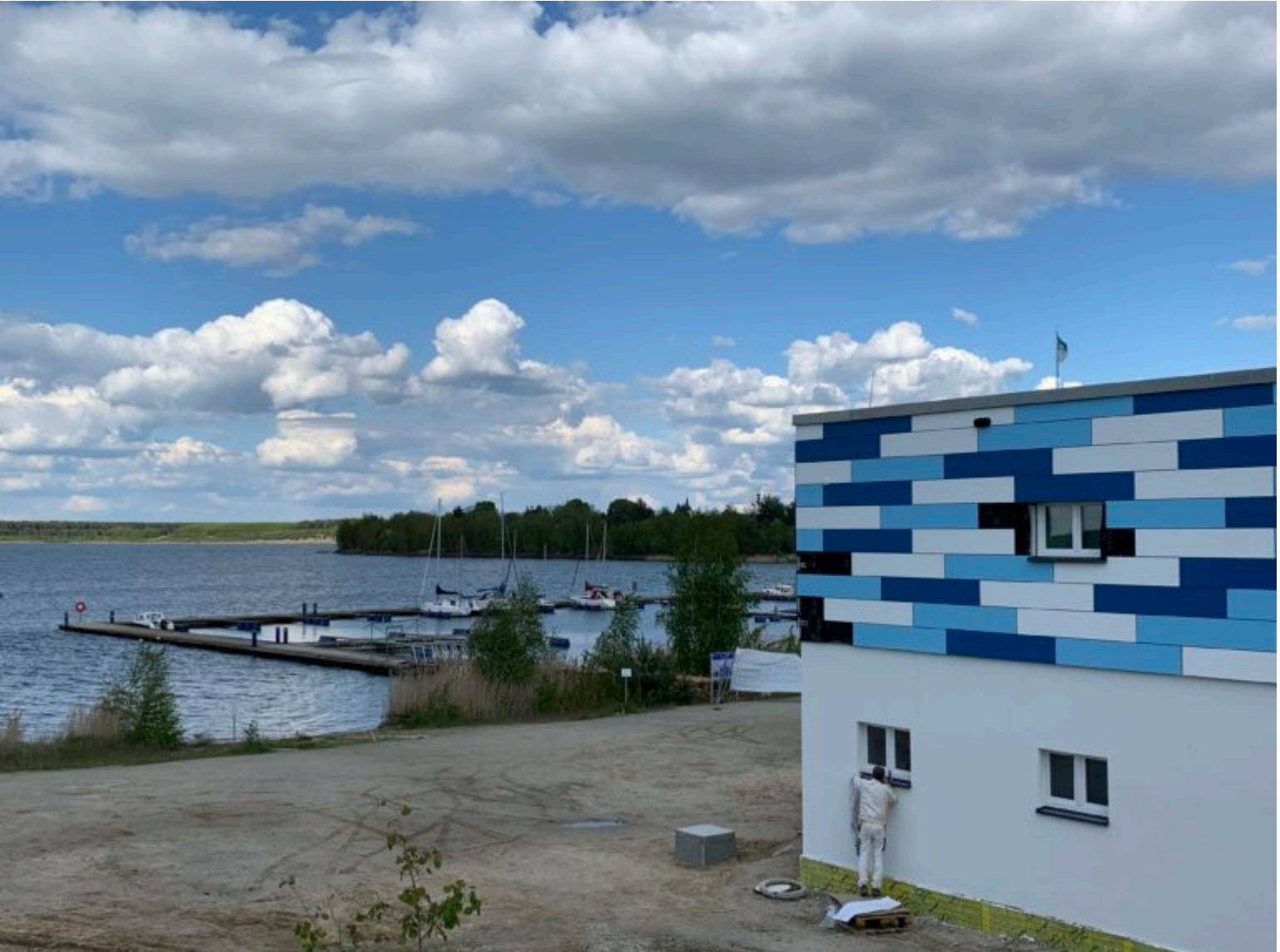
Investition von ZV LSS und LMBV am Bergbaufolgesee im Wachsen