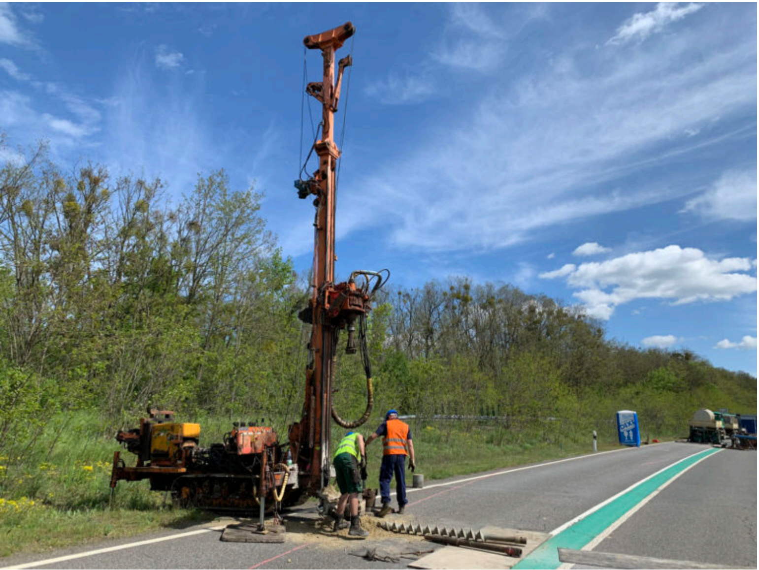
Bohren mit Gerät der BLZ Gommern