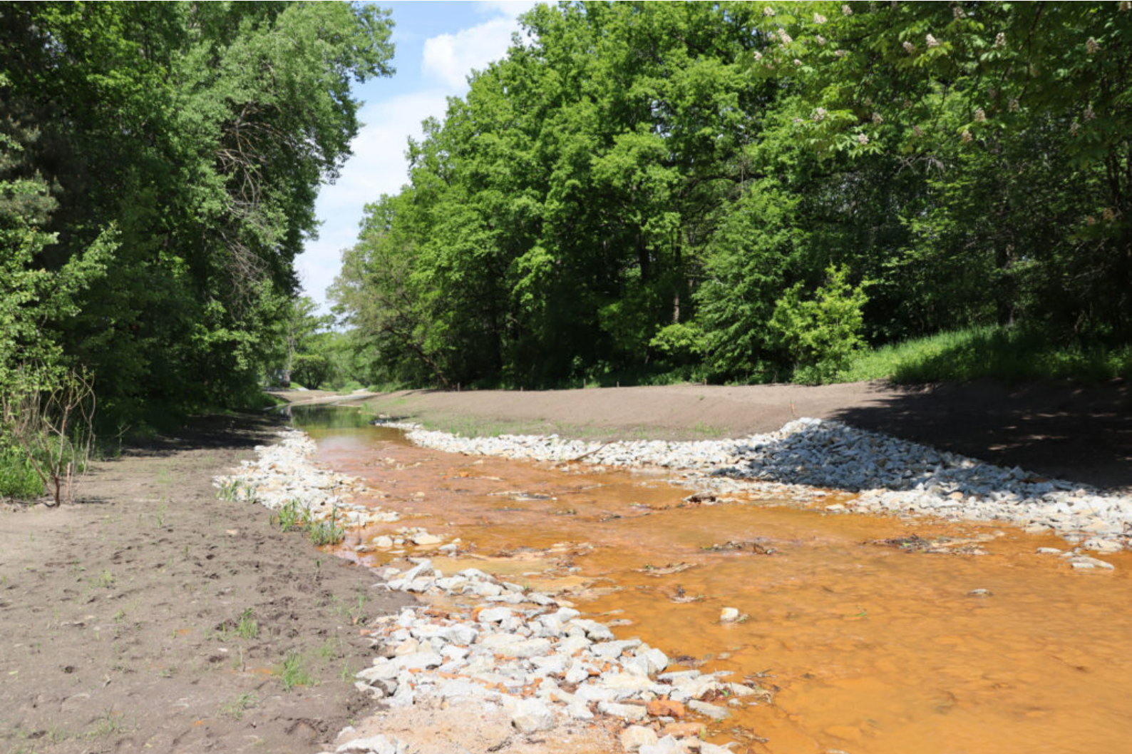
Blick von der eisenbelasteten Furt in Fließrichtung zur MWBA