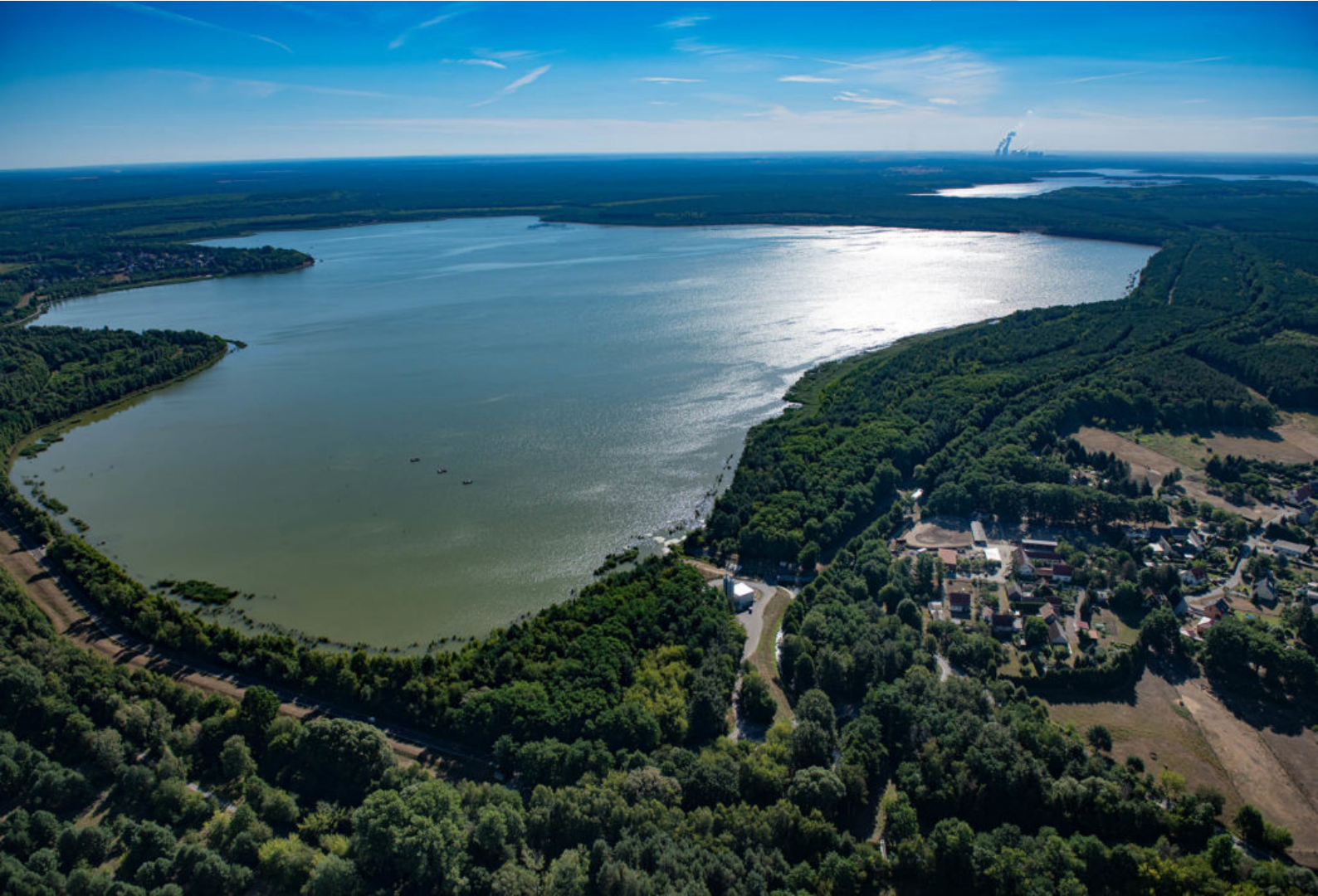
LMBV-Speicher Burghammer - Bernsteinsee in der Lausitz