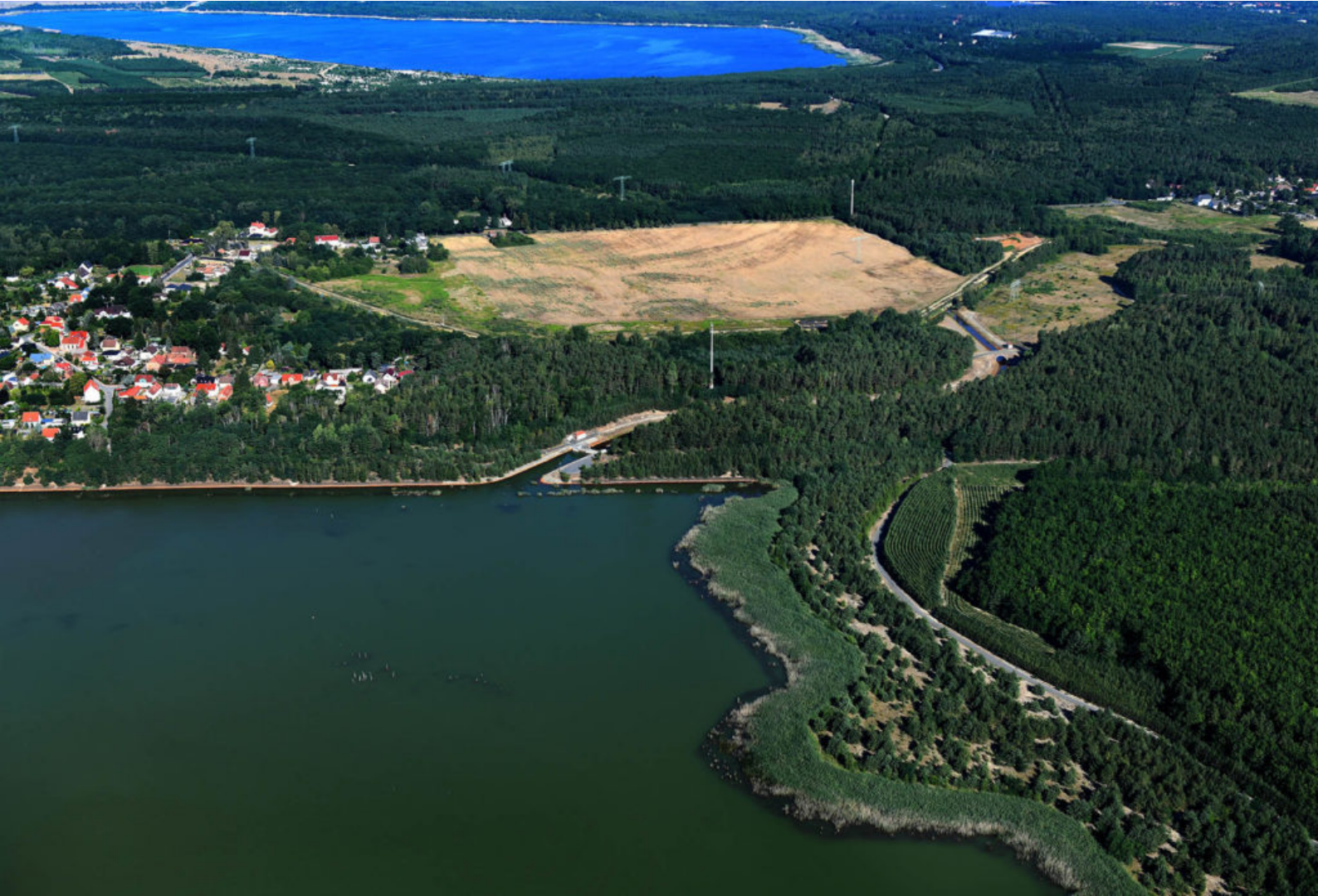
Auslaufbauwerk aus dem Speicher Burghammer zur Kleinen Spree