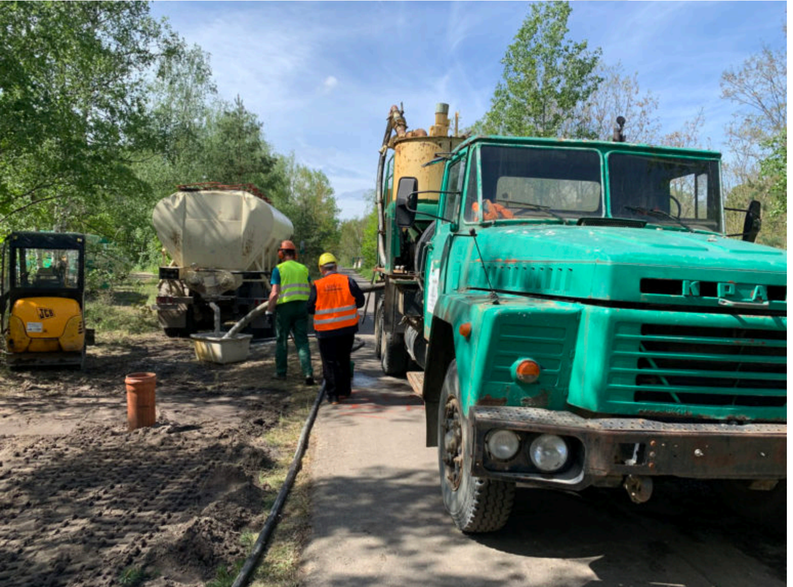
Technik auf dem Wirtschaftsweg im Einsatz