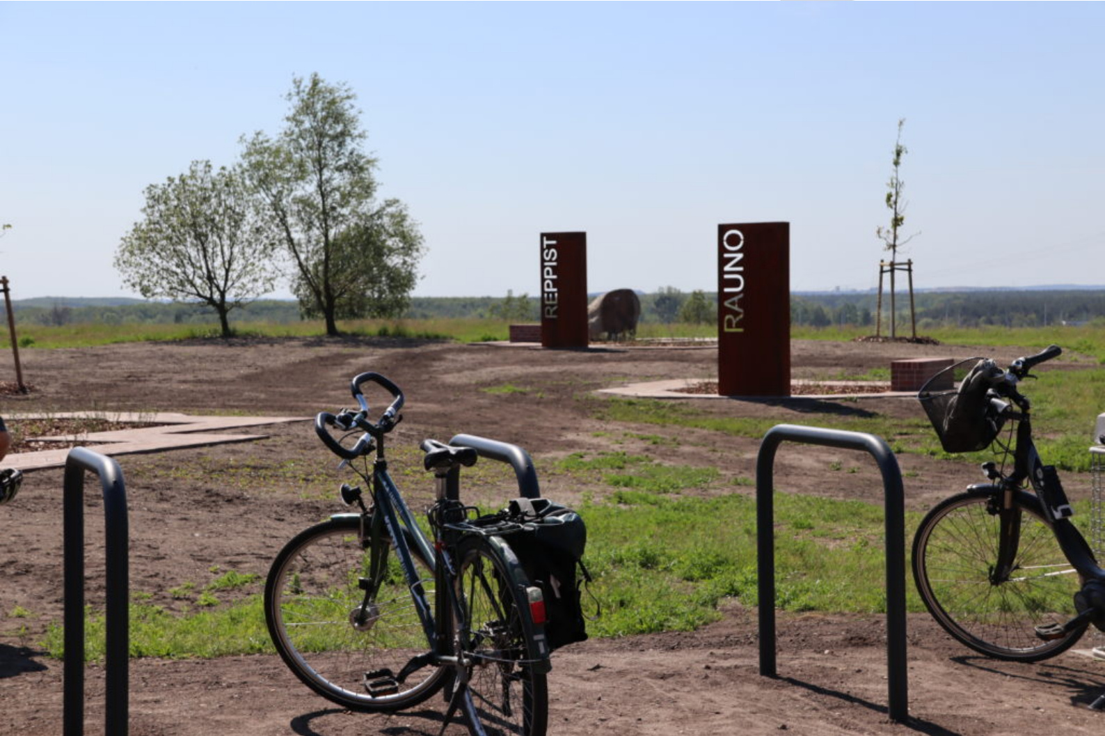
Erinnerung an verschwundene Orte am Aussichtspunkt Reppister Höhe