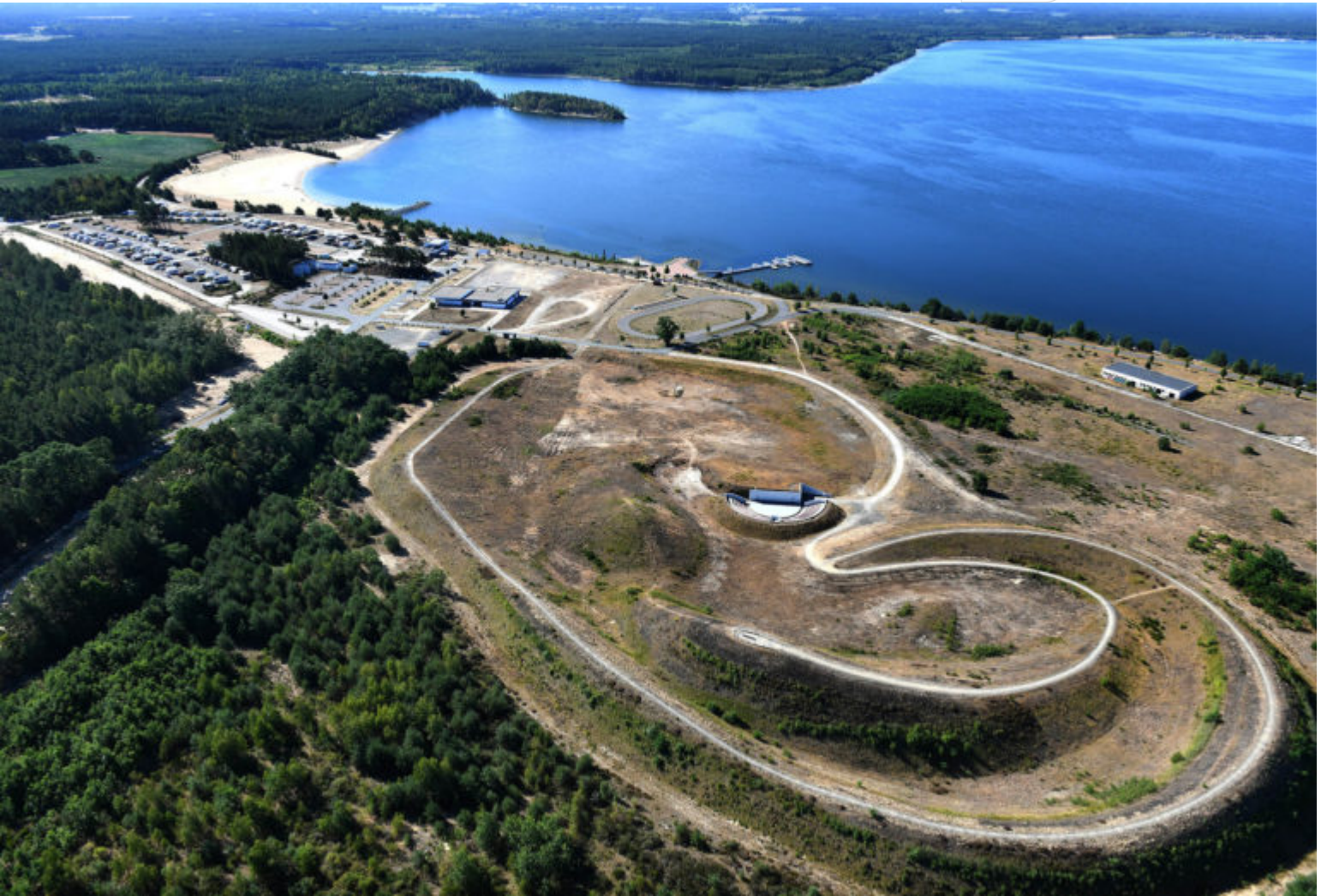
Landschaftsbauwerk OHR am See