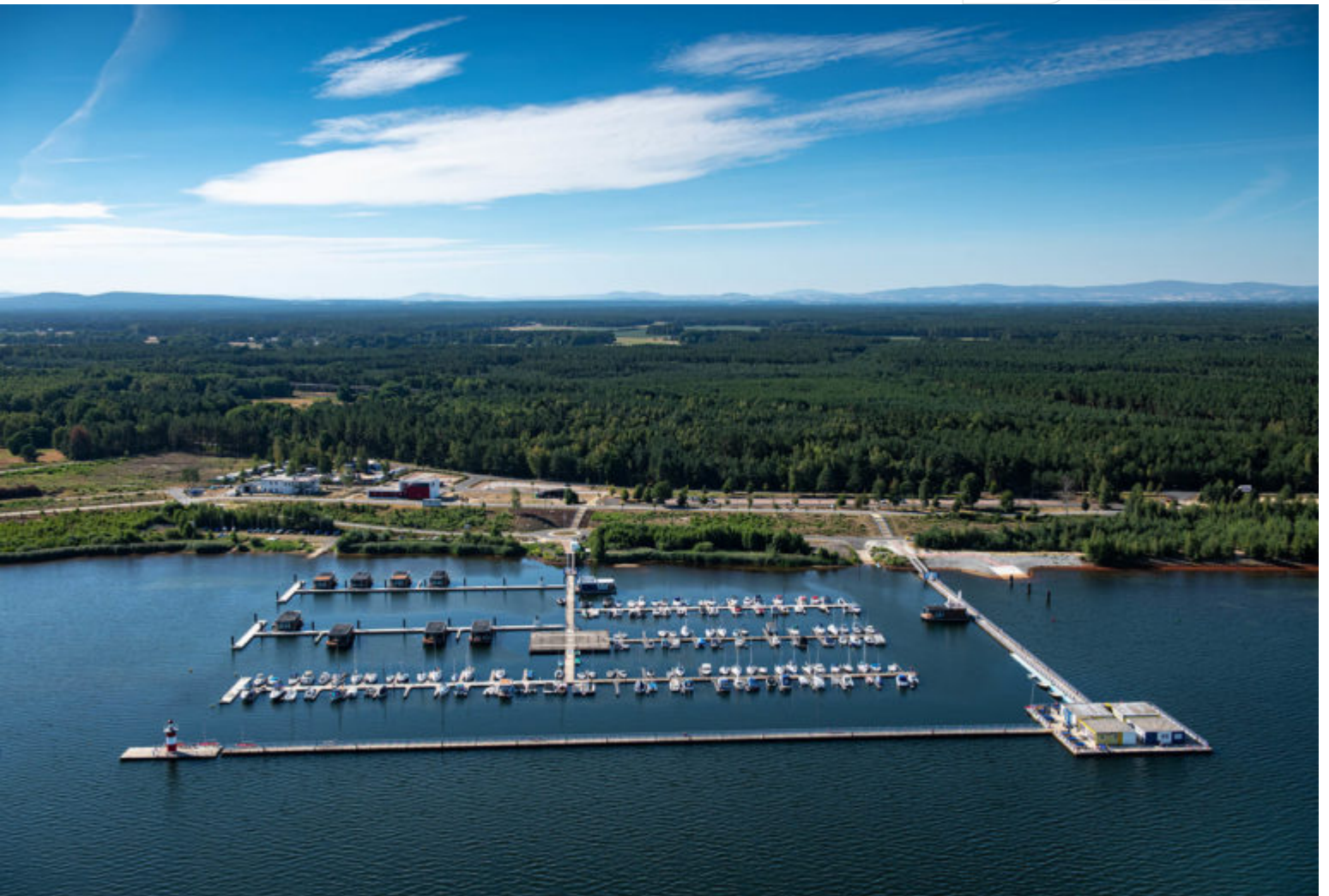
Marina Klitten – 2020