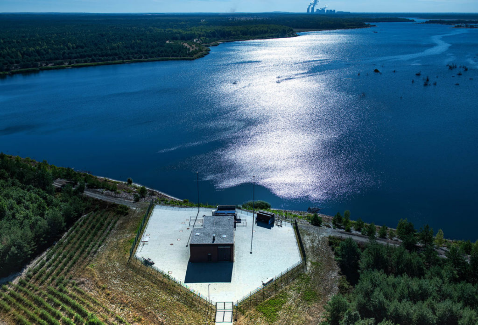
Blick über das Auslaufbauwerk auf den Speicher Lohsa II