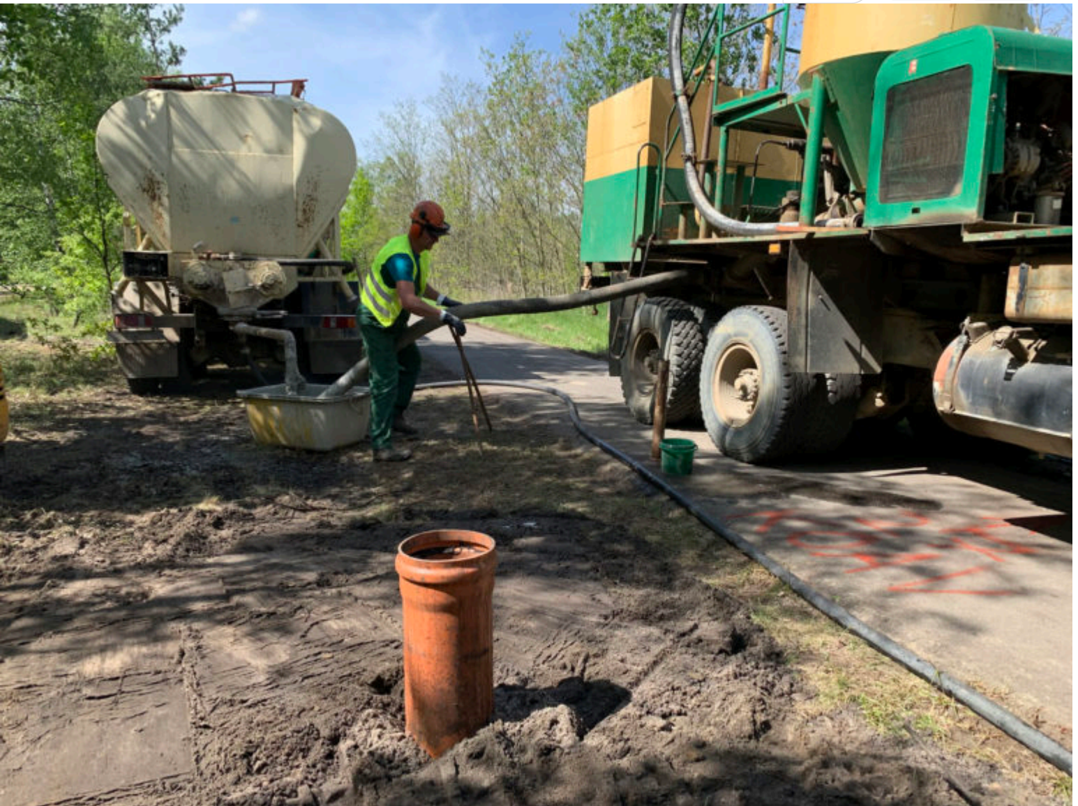
Nach Kernbohrung wurde verrohrt