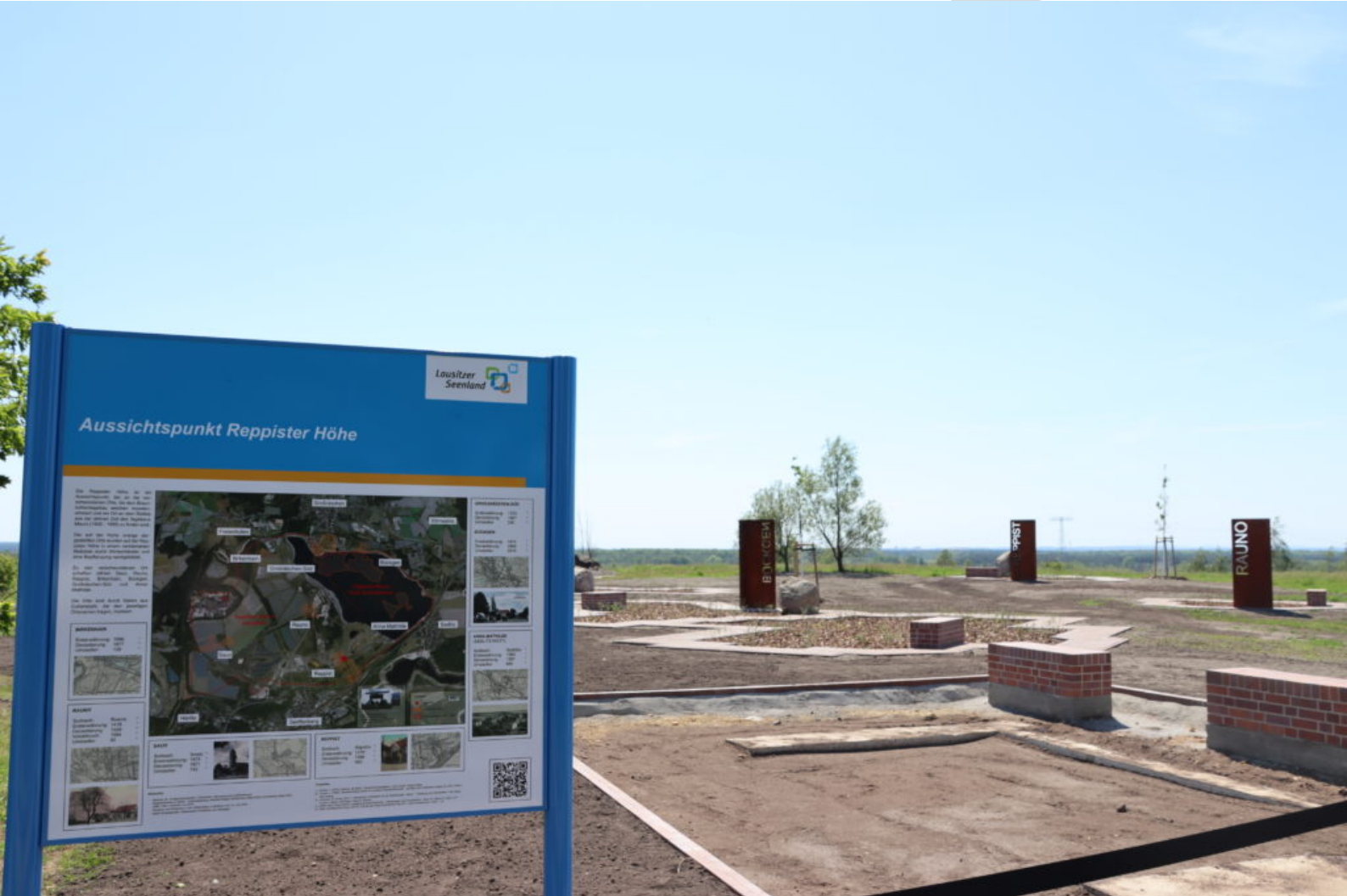
Erneuerter Aussichtspunkt Reppister Höhe fast fertig gestellt