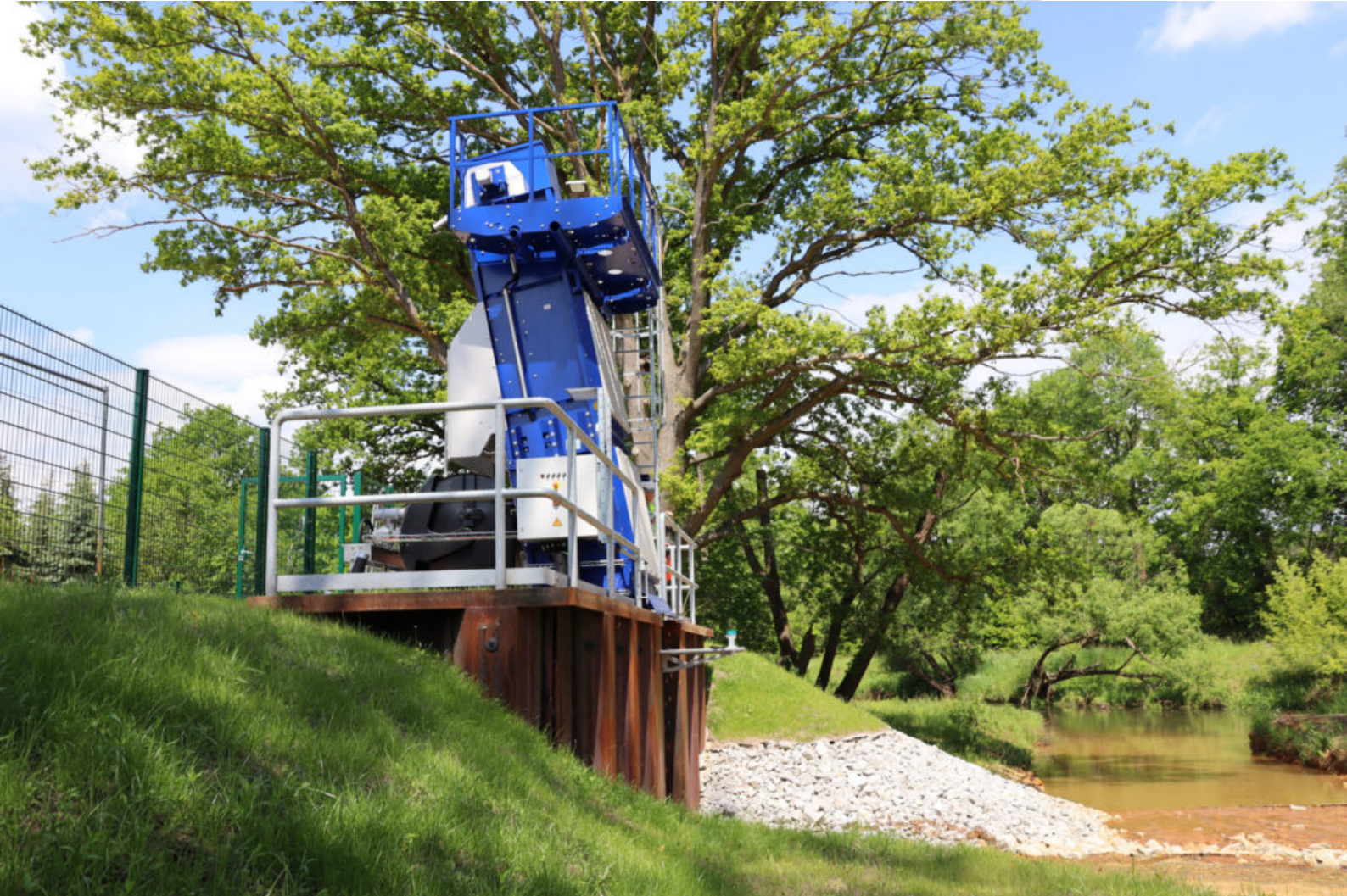
Automatische Rechenreinigungsanlage fängt Schwemmgut vor der Pumpstation der MWBA ab