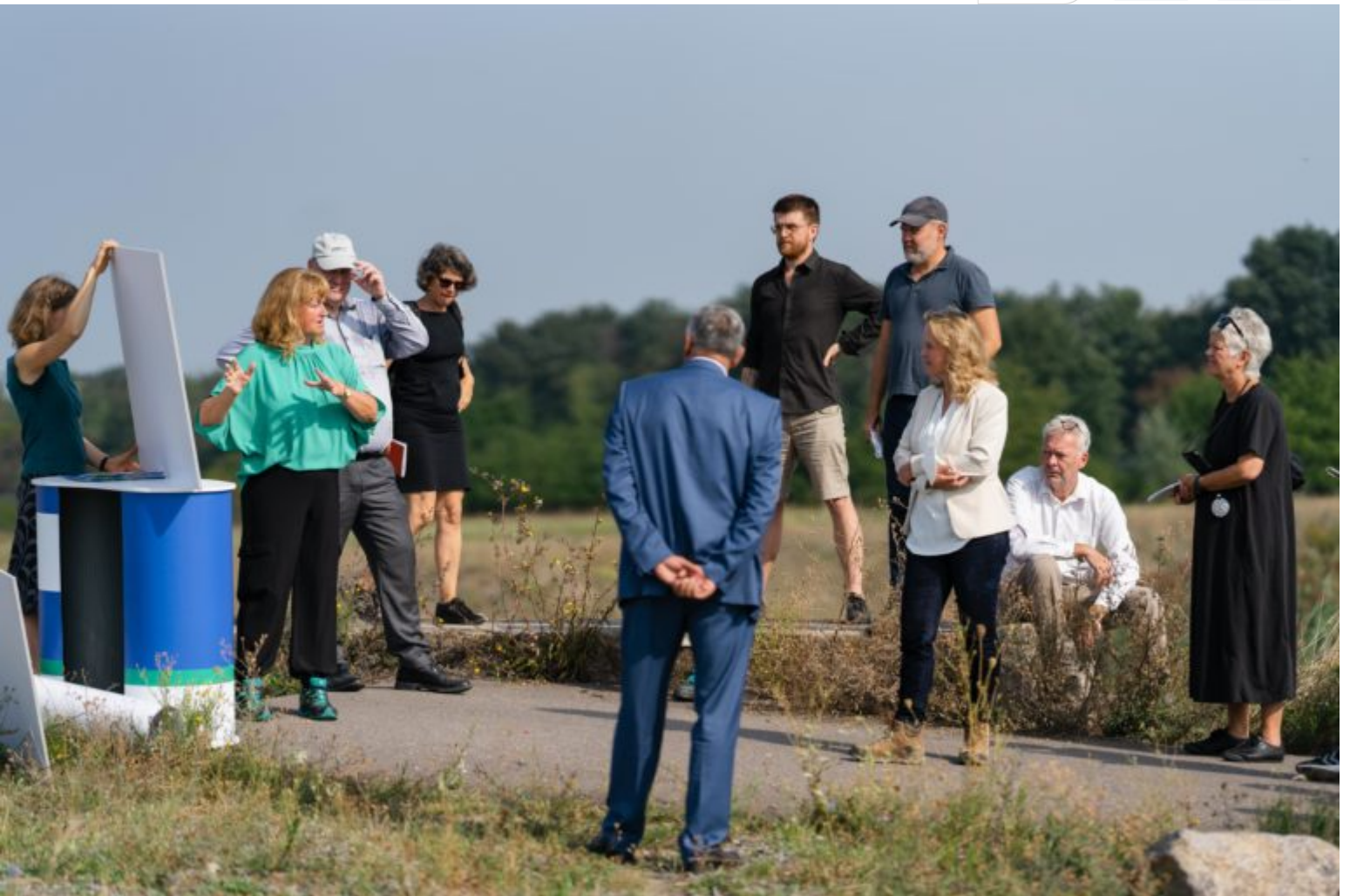
Auf ihrer Sommerreise wurde Ministerin Steffi Lemke von zahlreichen Journalisten begleitet.