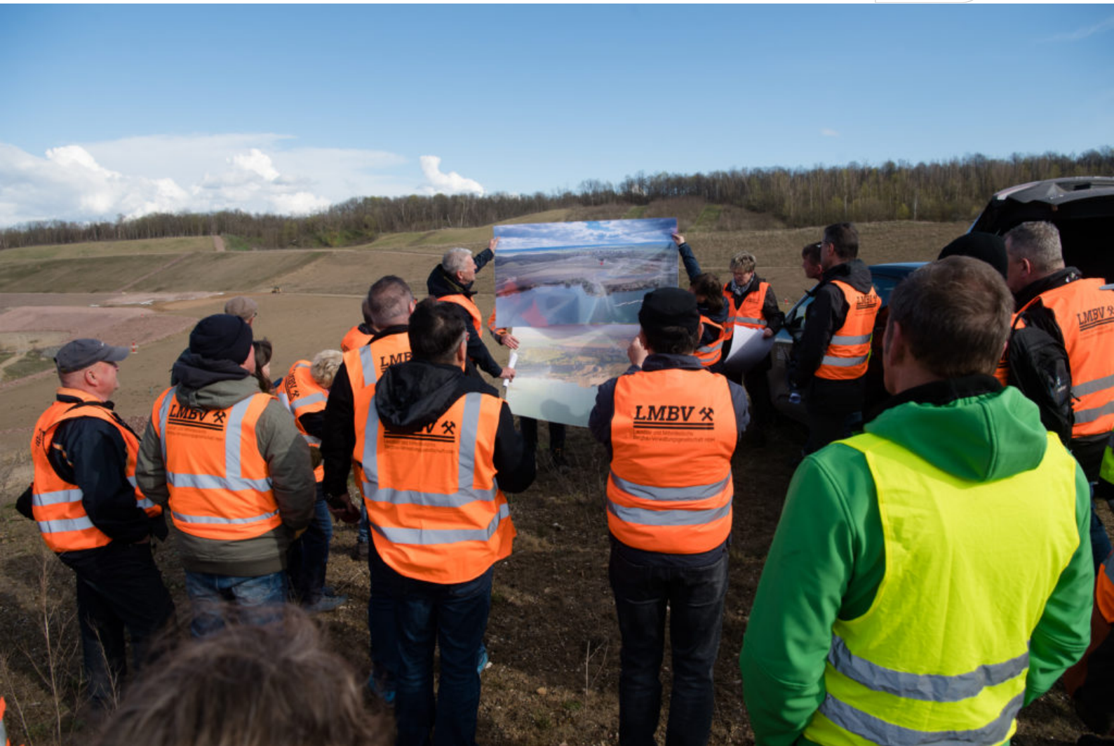
Impressionen von der Veranstaltung