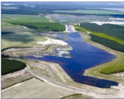
Bergener See 2008