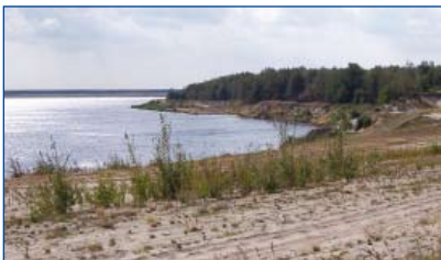
Künftiger Mündungsbereich in den Partwitzer See