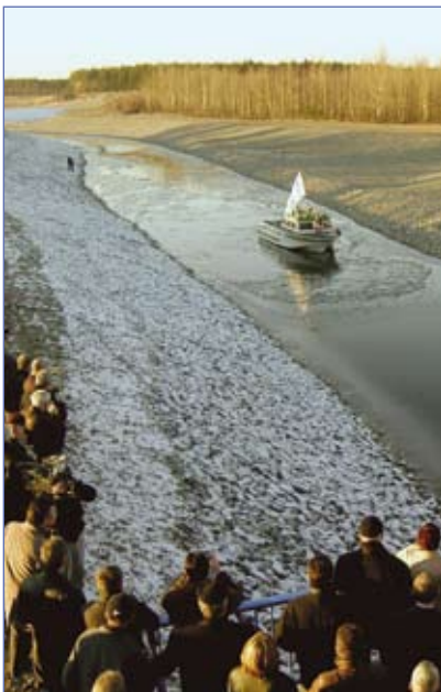
Überleiter auf der Seite des Geierswalder Sees