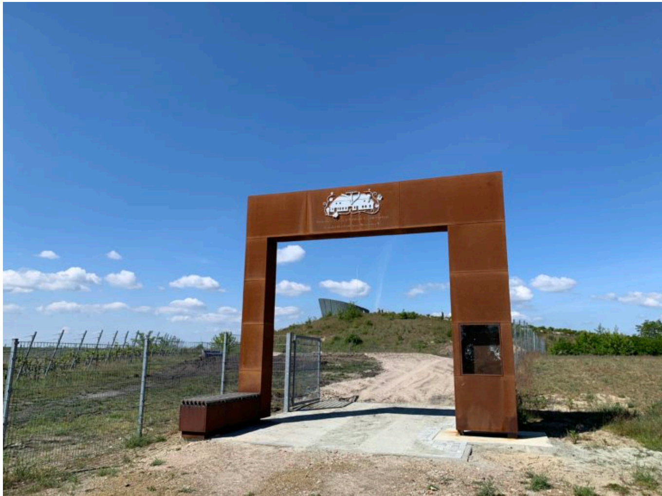
Weinberg-Tor am Großräschener See an der Victoriahoehe