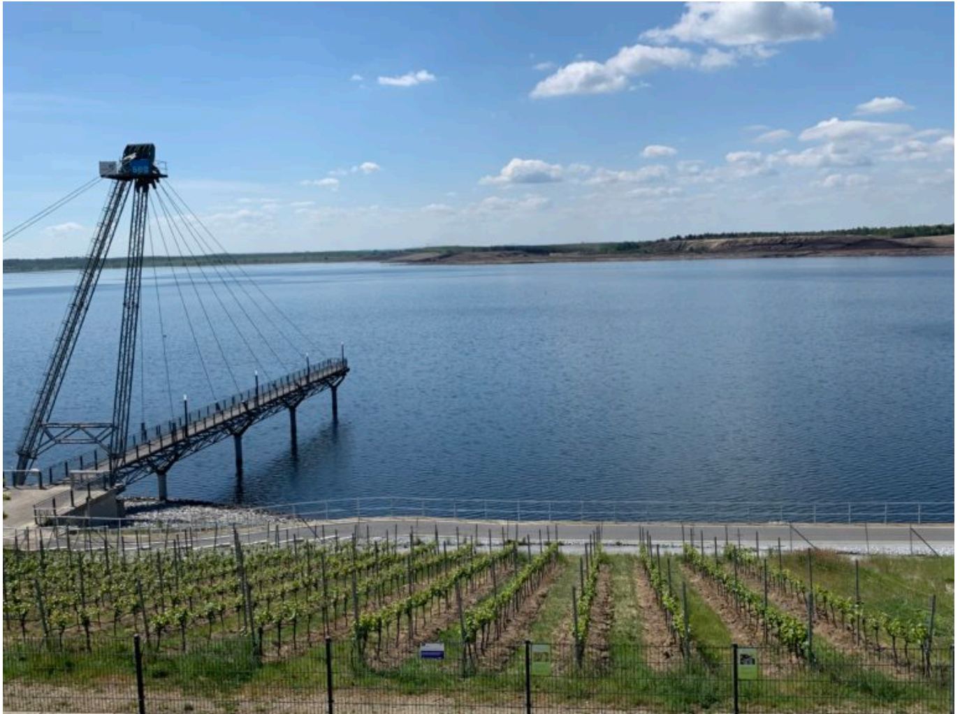
Seebrücke vor Weinberg am Großräschener See