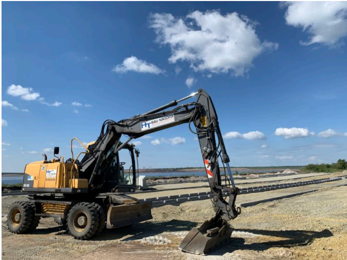
Parkplatzbau für den künftigen Stadtstrand am Großräschener See