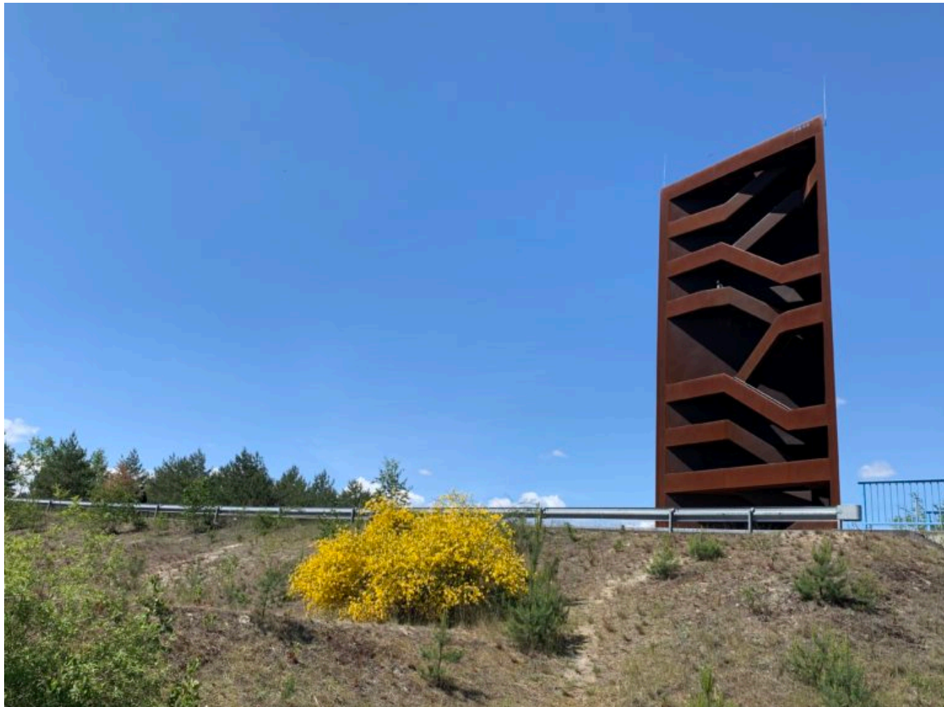
Rostiger Nagel im Mai 2020