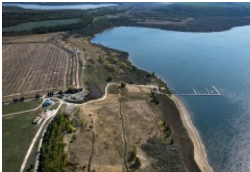
Nordufer des Concordia Sees (2018)