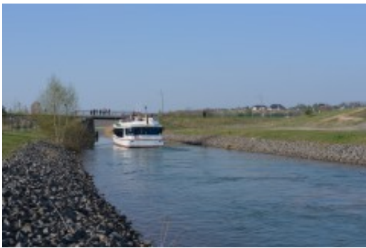
Ein Kopflander fährt bereits auf anderen Seen

Senftenberg/Boxberg. Wie die Anliegerkommune Boxberg/O.L., kürzlich informierte, sucht die Gemeinde nun einen „Reeder“ über ein Interessenbekundungsverfahren zum „Betrieb einer Fahrgast- bzw. Ausflugsschiffahrt auf dem Bärwalder See“.