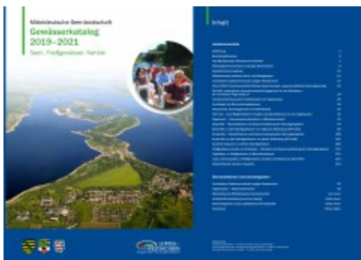
— Ausschnitt vom Cover des „Gewässerkatalogs