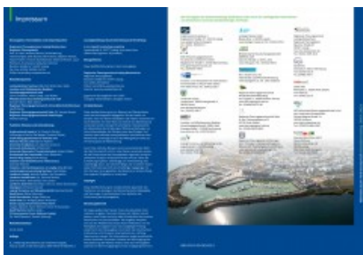
— Ausschnitt II vom Cover des „Gewässerkatalogs