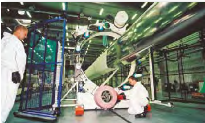
Fertigung von Rotorblättern bei Vestas