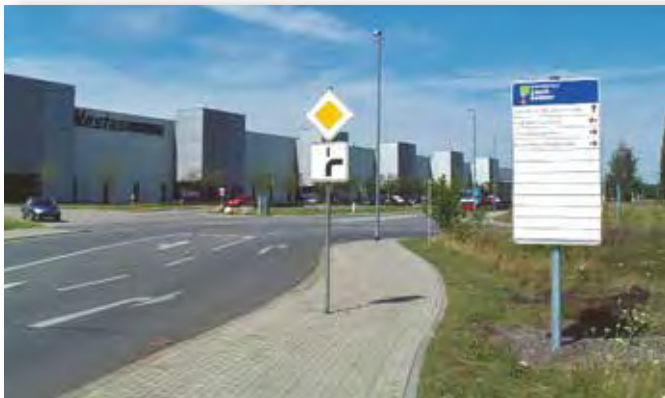
Einfahrt zum Industriepark