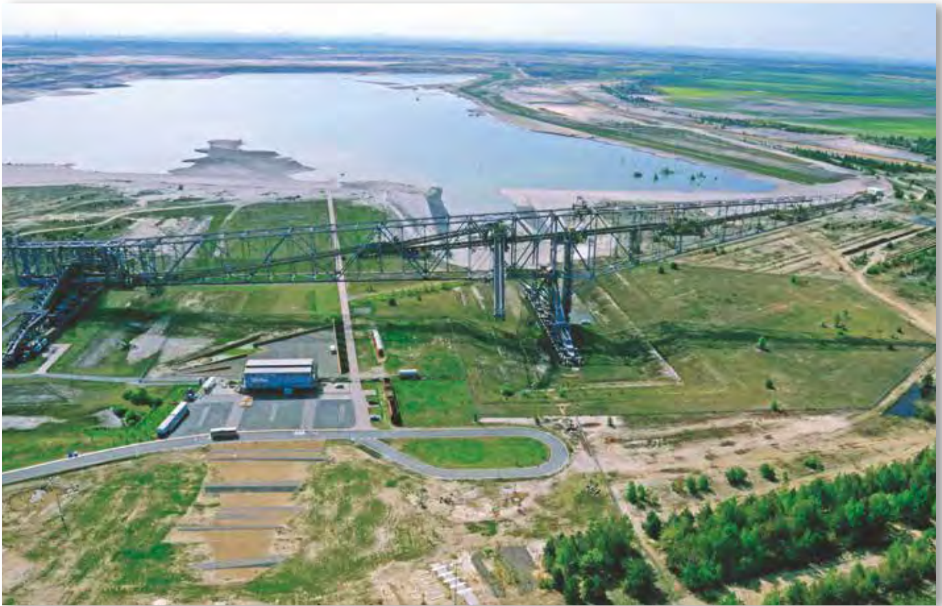
Der Bergheider See mit dem Besucherbergwerk Abraumförderbrücke F60

Der Lausitz-Industriepark Lauchhammer ist ein wichtiger Industriestandort im Süden des Landkreises Oberspreewald-Lausitz.