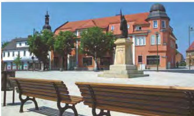
„Germania“ Marktplatz in Lauchhammer-Mitte