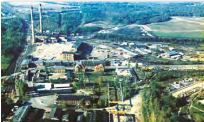
Der Standort des heutigen Industrieparks im Jahr 1995