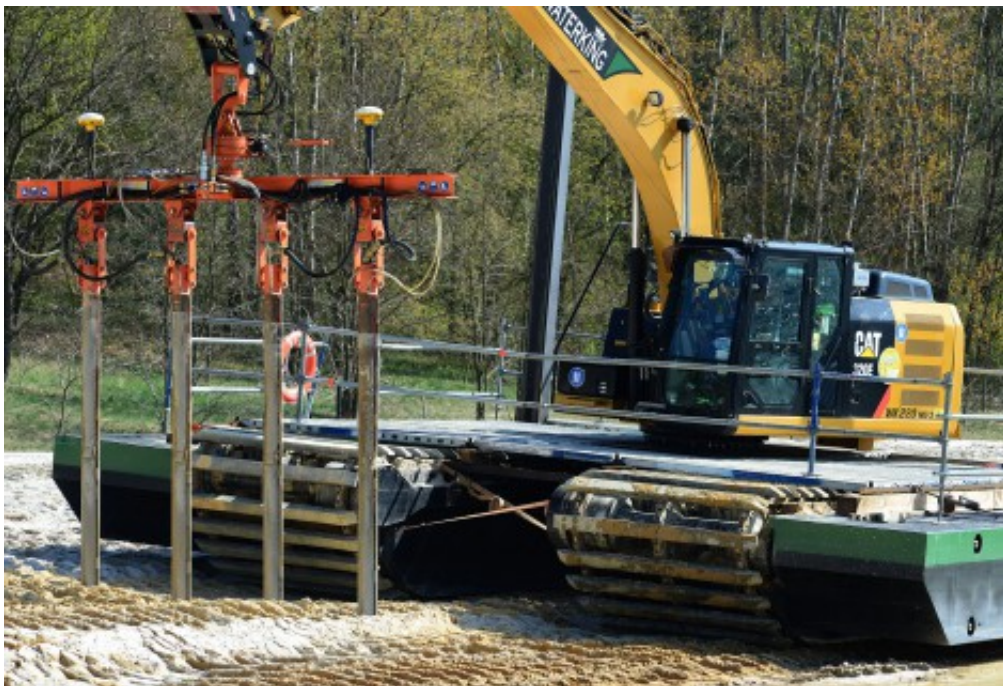
Leichte Rüttelverdichter am Ufer und ufernah im Einsatz