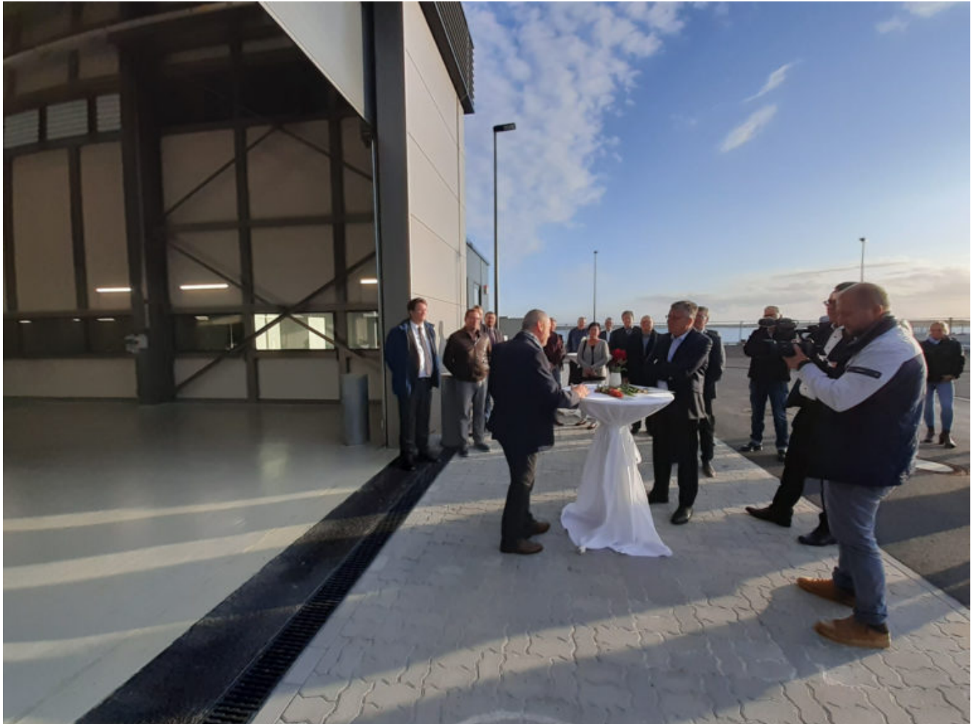
Am Sanierungsstützpunkt wurde der symbolische Schlüssel übergeben