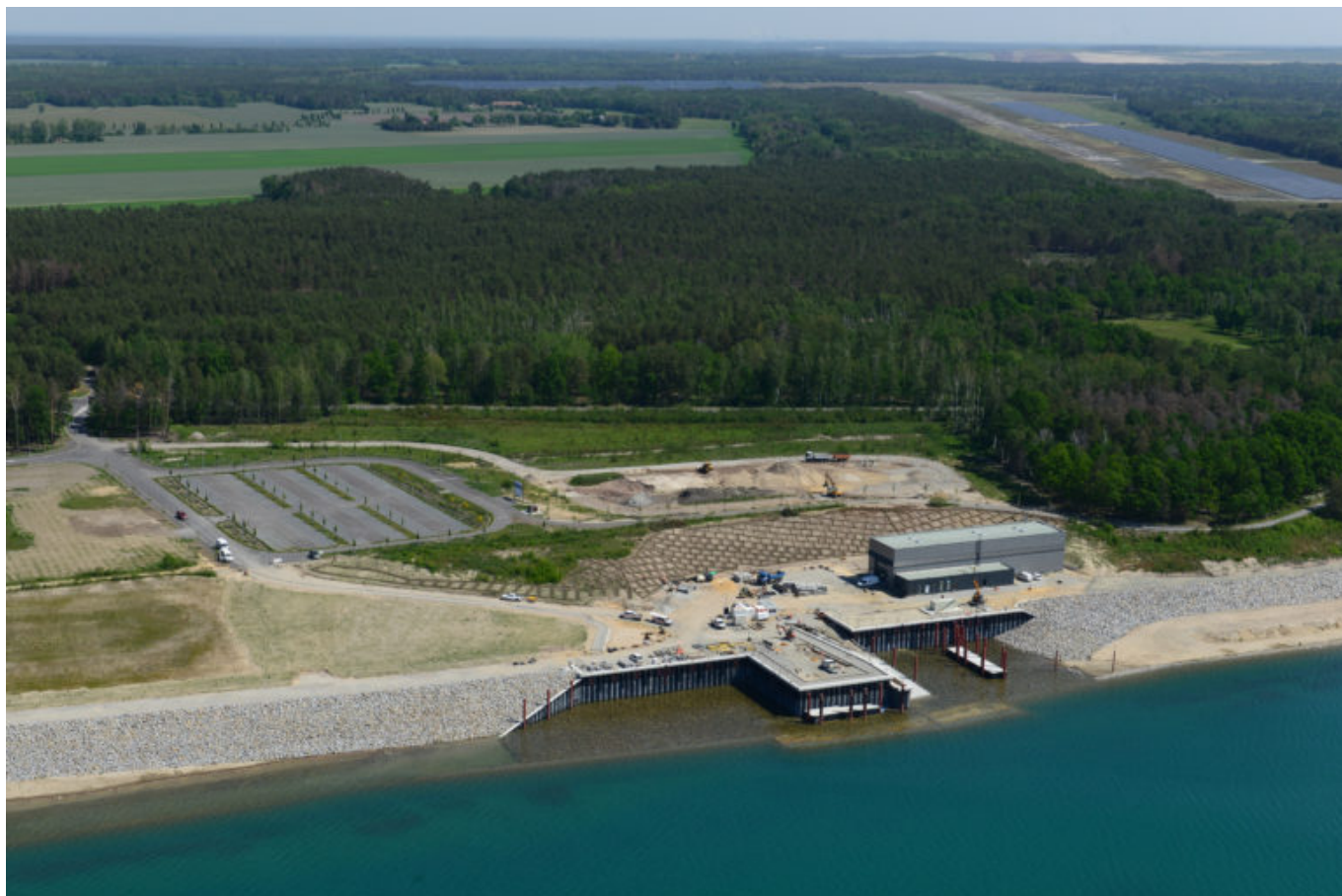
Sanierungsstützpunkt von oben (Juni 2021)