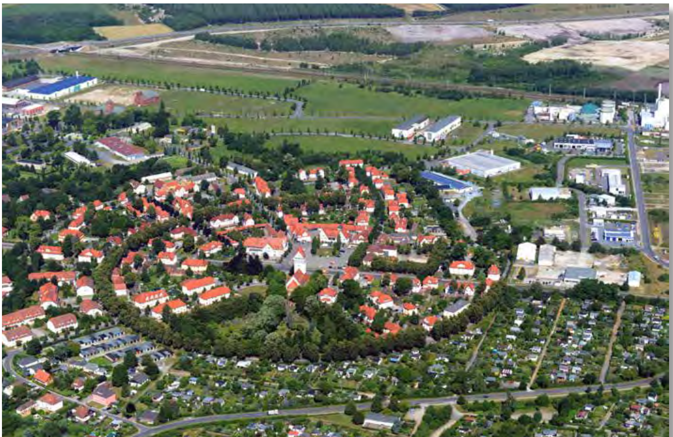
Die Gartenstadt Marga mit dem Industriepark im Hintergrund

Erkennen Sie rechtzeitig Ihre Chancen und profitieren Sie von den großen Vorzügen einer sich neu entwickelnden Wirtschaftsregion!