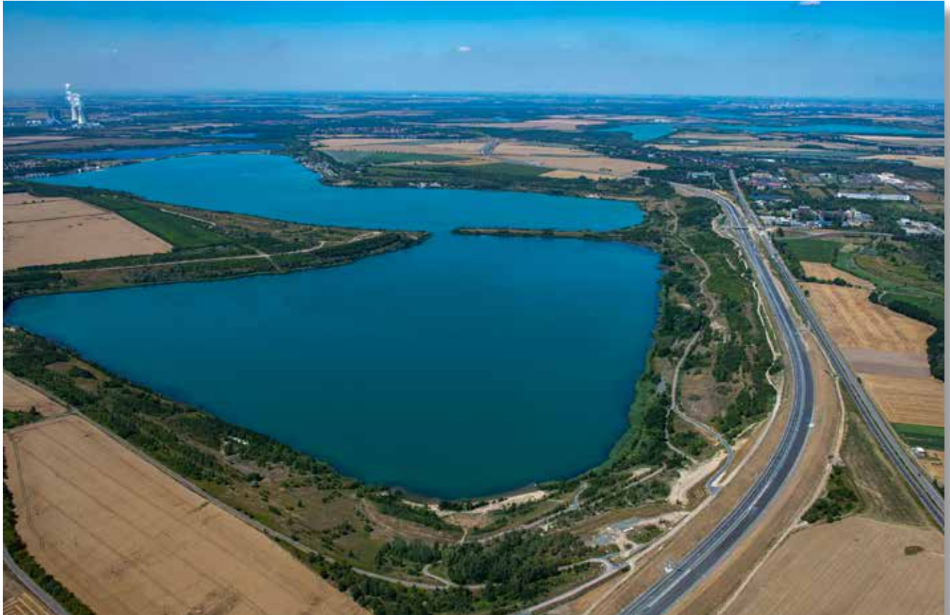
Blick über das Leipziger Neuseenland - Hainer See mit Mitteldeutschem Industriepark Espenhain (rechts) 2019

Der Mitteldeutsche Industriepark Espenhain ist ein Industriestandort mit Tradition. Über Jahrzehnte hinweg war er ein Schwerpunkt der Braunkohleindustrie im Süden der Stadt Leipzig. In den letzten Jahren wurde durch Abriss- und Sanierungsmaßnahmen Platz für großflächige Industrie- und Gewerbeansiedlungen geschaffen.