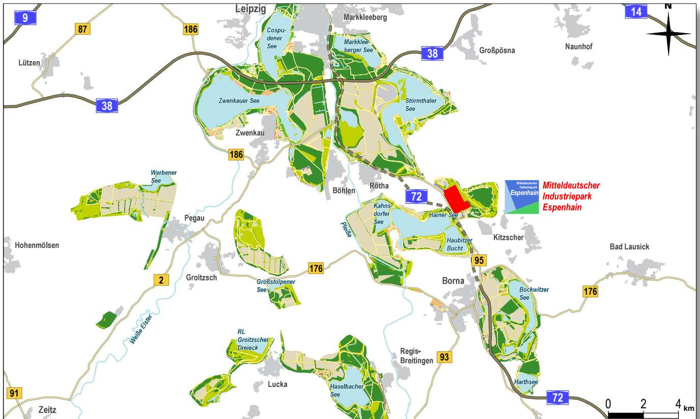
Lage des Industrieparks im Südraum von Leipzig