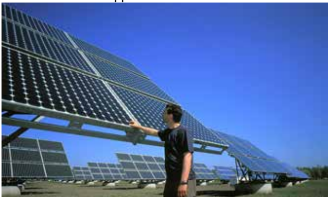
Solarpark Borna auf LMBV-Flächen