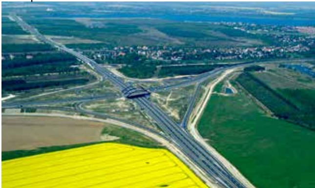
Autobahnkreuz Leipzig-Süd (A38/A72)