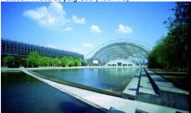
Neue Messe Leipzig