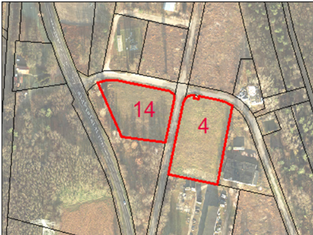
Luftbild Stand 10/2024