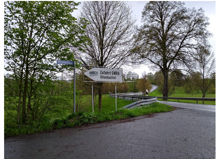
Beschilderung an der B 242