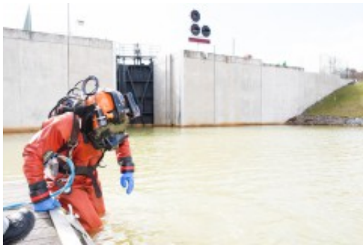
Kontrolltauchgang am 7. April 2021 i.A, der LMBV