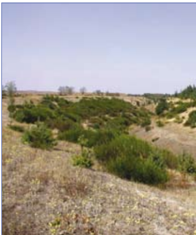
Vegetation im Bereich des Überleiters

Baumaßnahmen • Bau einer Brücke und Schleuse